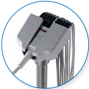
Halterung mit Multilink-Kabel

Der einfache Arm ist kompatibel mit EKG-Anschlusskabeln und Multilink-Kabeln.